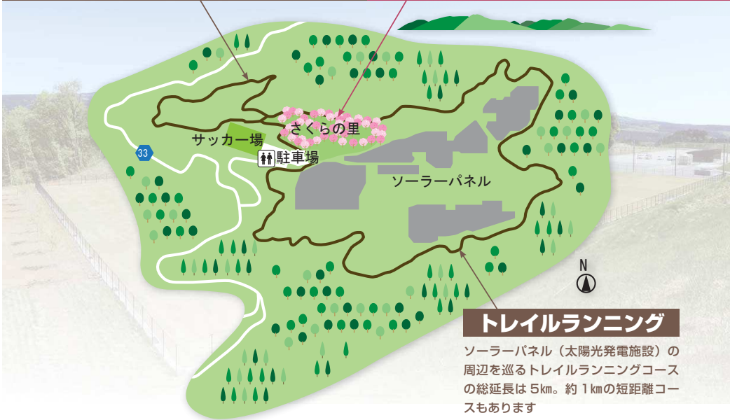
トレイルランニング

ソーラーパネル (太陽光発電施設) の周辺を巡るトレイルランニングコースの総延長は5km。約1kmの短距離コースもあります