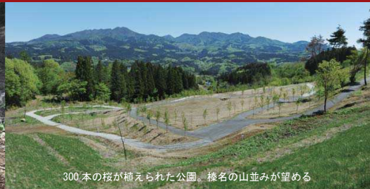
300本の桜が植えられた公園。桜名の山並みが望める