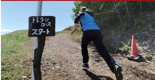
トレイルランニング