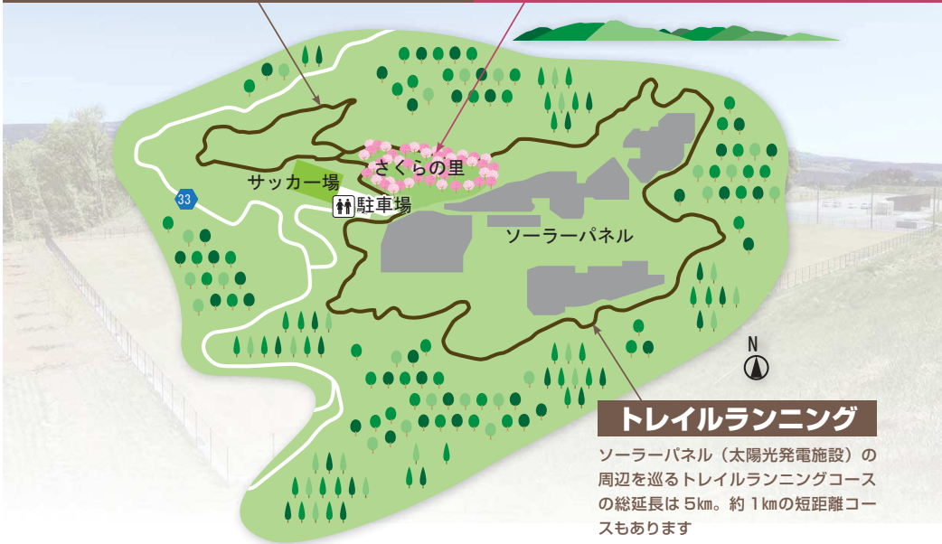
トレイルランニング

ソーラーパネル (太陽光発電施設) の周辺を巡るトレイルランニングコースの総延長は5km。約1kmの短距離コースもあります